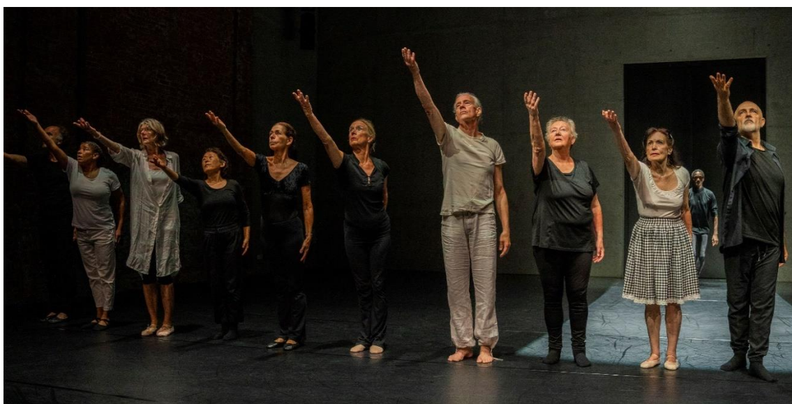
Senioren bij DSDC

Om diverse publieksgroepen te bereiken kiezen wij allereerst voor participatieprojecten. Daarmee betrekken we deelnemers uit verschillende wijken in de stad en met de diverse achtergronden die we hiervoor benoemden. De deelnemers nemen weer publiek mee dat hun diversiteit weerspiegelt. Dat weten we inmiddels uit ervaring.