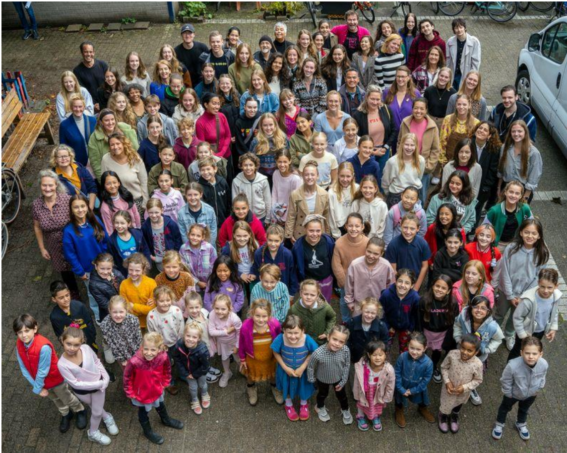
Alle participanten van Alice in Escherland

Dit community project was een coproductie met Amare. Helaas had het Residentie Orkest al andere afspraken zodat dit jaar niet met live muziek gewerkt kon worden. Het project werd mogelijk gemaakt door een groot aantal donaties van zowel de Gemeente Den Haag, Fonds 1818, CultuurSchakel, Keep an Eye Foundation en Holland Dance Festival.