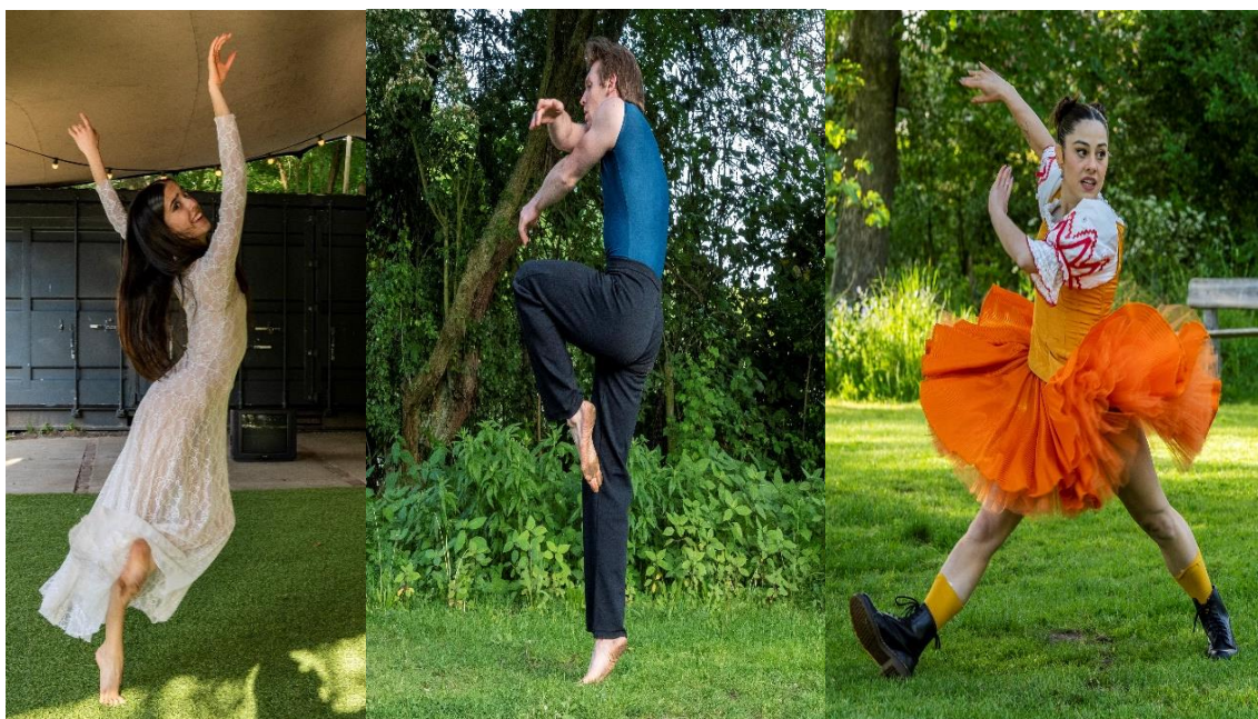
Onze dansers in actie in Solo's @ the Park

DeDDDD profileert zich als hét Stadsdanzgezelschap van Den Haag en ziet de stad dan ook als haar podium. Door haar brede en flexibele inzetbaarheid is zij steeds weer duidelijk zichtbaar aanwezig in Den Haag. En vormt zo een belangrijke verbindende en cruciale schakel in de Haagse dansketen. Door samenwerkingen en coproducties heeft DeDDDD een bijzondere, vaste plek in het Haagse culturele veld verworven en is daar inmiddels niet meer weg te denken. DeDDDD is aanwezig op evenementen en festivals. Verder verzorgt zij locatieprojecten, schoolvoorstellingen en voorstellingen in diverse theaters in de stad. Ook worden dansoptredens verzorgd in musea, concertzalen, parken, kerken en andere ongebruikelijke locaties. Zo bereikt DeDDDD een breed en nieuw publiek dat anders niet zo gauw met dans in aanraking zou zijn gekomen.