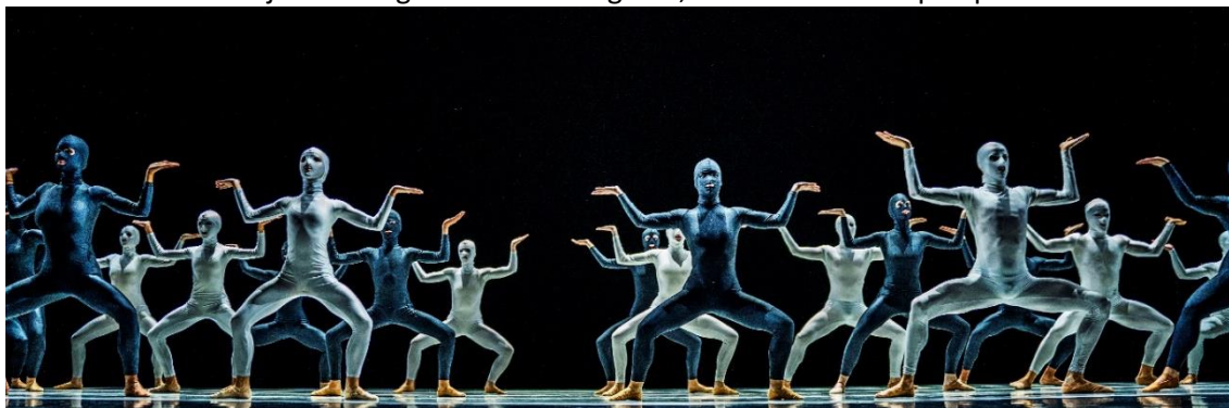
Still uit Alice in Escherland

De toeschouwers worden ondergedompeld in een oneindige zwart/wit wereld. Eeuwigdurende bewegingen, waarbij begin en eind niet meer te onderscheiden zijn, tonen de wereld van de Haagsche kunstenaar en graficus M.C. Escher in dans. De dansvoorstelling werd door muziek van Bach begeleid, al dan niet in een moderner jasje gestoken. Een zwart/wit decor vertaalt zijn typerende concepten als de toren van Babel, de Mobius-band met daarin bekende items uit zijn tekeningen met oneindigheid, metamorfose en perspectief.