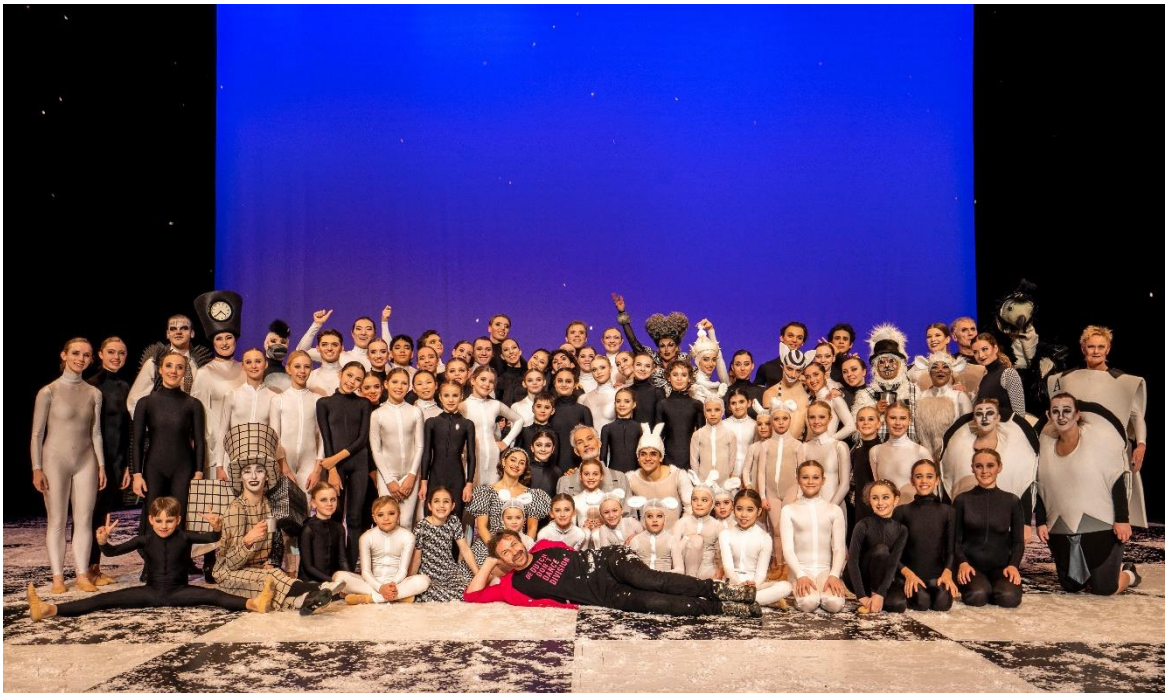
Alice in Escherland

Behorend bij de Jaarrekening 2023 van De Dutch Don't Dance Division.