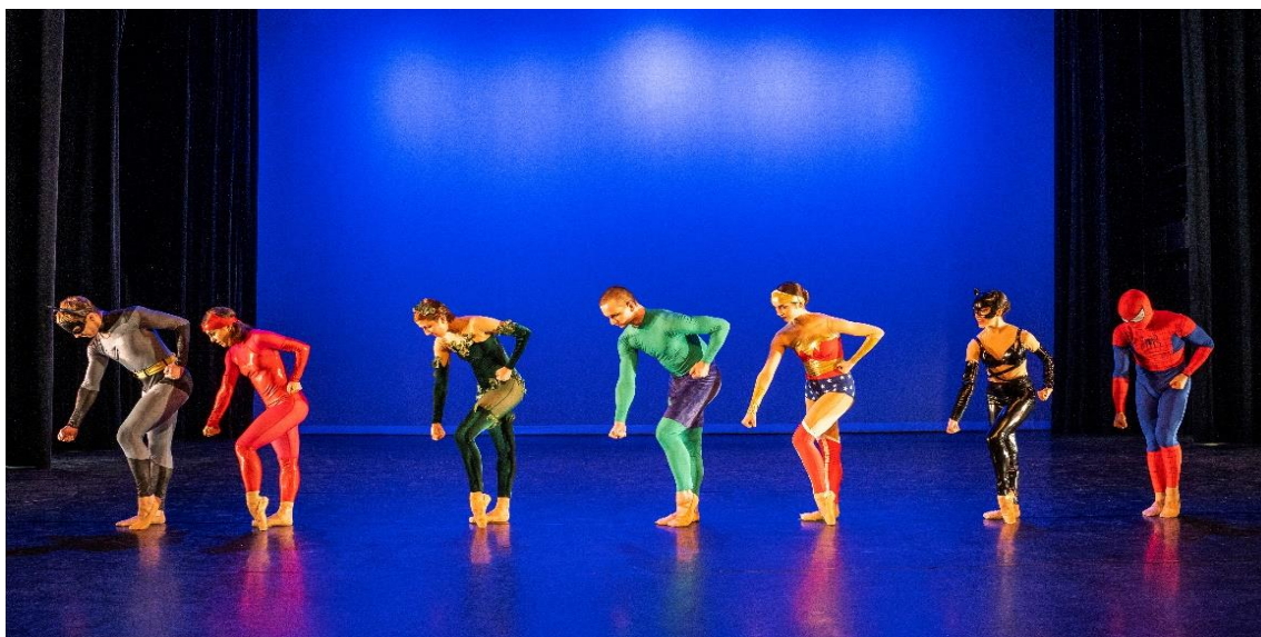
Dance @ the Movies

Dance @ the Movies , Passie op de Kaag , Solo's @ the Park , End of Season in onze eigen studio en natuurlijk ons educatief project Metamorfose . En daarnaast nog een aantal incidentele producties zoals: Unheard Music Festival met Matangi , Solo's @ de Stenen Kamer , Spotlight Festival in Muzee , Strandperformance voor De Regentes , Huygensfestival en Museumnacht . En niet te vergeten een aantal activiteiten i.h.k.v. het Escherjaar.